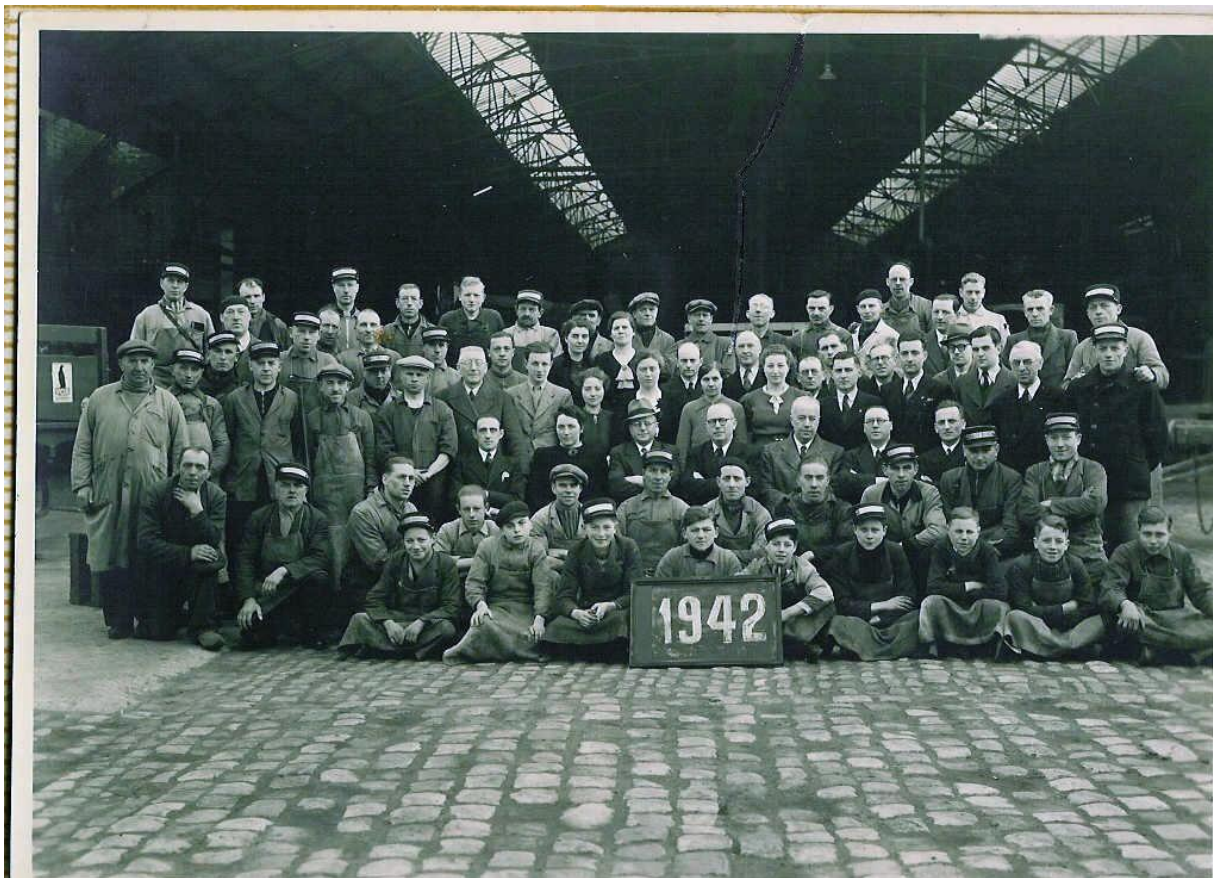
De werknemers van de Populieren, in de oorlogsjaren.

Heeft u zelf nog herinneringen of materiaal van de brouwerij De Populieren? Signaleer het ons, wij komen er op terug in ons volgende nummer, of spelen het door aan de Heemkundige Kring!